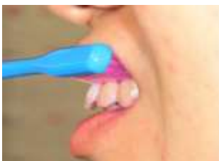
歯と歯ぐきの境い目